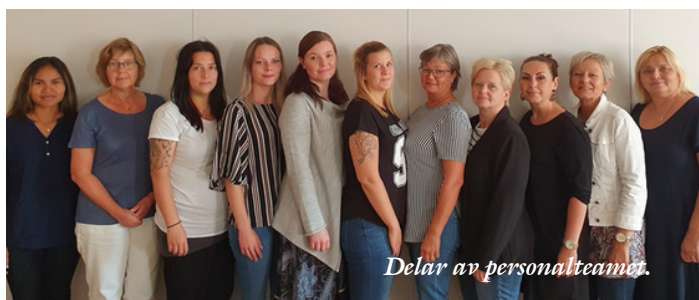
Delar av personalteamet.

Personalteamet är tvärprofessionellt och består av undersköterskor, sjuksköterskor, arbetsterapeut, fysioterapeut och biståndshandläggare.