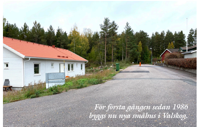
För första gången sedan 1986 byggs nu nya småhus i Valskog.

Kommunen har ett mål om att det ska byggas 100 nya bostäder mellan 2016 och 2020. Nu visar statistik från SCB